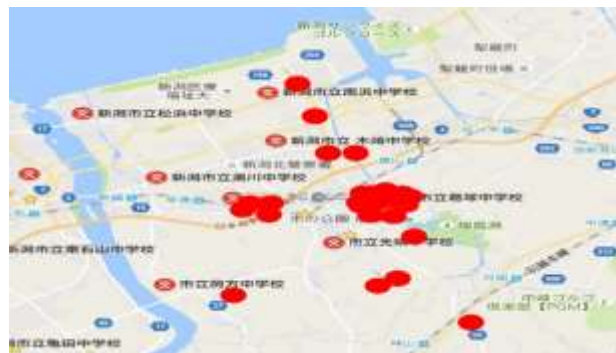
平成29年11月末までの登録患者

平成29年11月末と平成30年12月末の登録患者の住所を地図上にプロットすると、新崎地区と濁川地区の患者さんが増えています。北区の在宅医療のセーフティネットとして機能してきたようです(柄澤)。